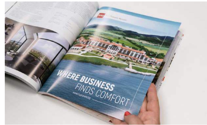
* Твърда вътрешна страница

Размер: страница (228x275мм) + фолио (436x275мм), 250гр. гланц или мат по избор