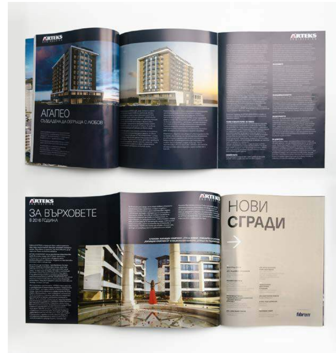
** Твърда вътрешна разгъвка (1стр+2 фолио)