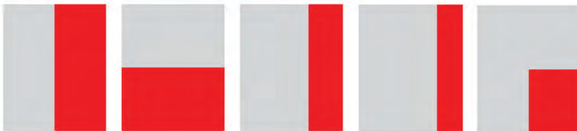
1/2 страница необрязан: 113 x 301 mm обрязан: 110 x 295 mm 1/2 страница необрязан: 227 x 150 mm обрязан: 224 x 147 mm 1/3 страница необрязан: 75 x 301 mm обрязан: 72 x 295 mm 1/4 страница необрязан: 57 x 301 mm обрязан: 56 x 295 mm 1/4 страница необрязан: 112 x 150 mm обрязан: 109 x 147 mm