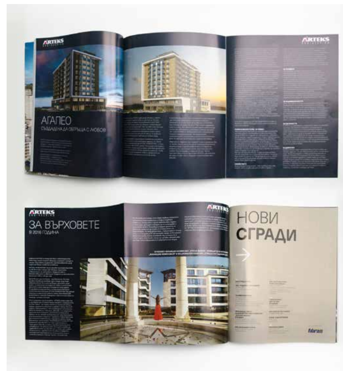
Твърда вътрешна разгъвка (1стр+2 фолио)