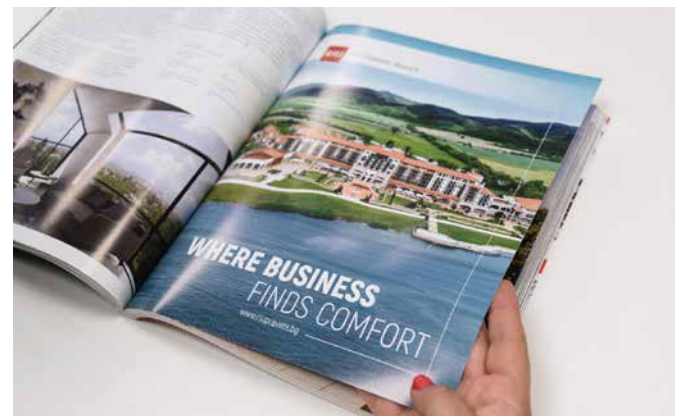
Твърда вътрешна страница (крило)

Размер: страница (228x275мм) + фолио (436x275мм), 250гр. гланц или мат по избор