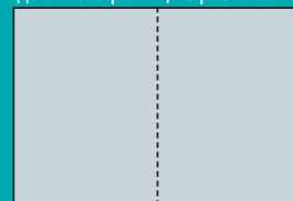
двойна страница с разгъване

Готови карета: EPS файл - ASCII, без Bleed Area. PDF файл - Резолюция 2540 dpi. Компресия на снимките JPEG Maximum Quality. Компресия на щриховите елементи (bitmap) ZIP/LZW. Да не се използва опция „Subset“ за шрифтовете.